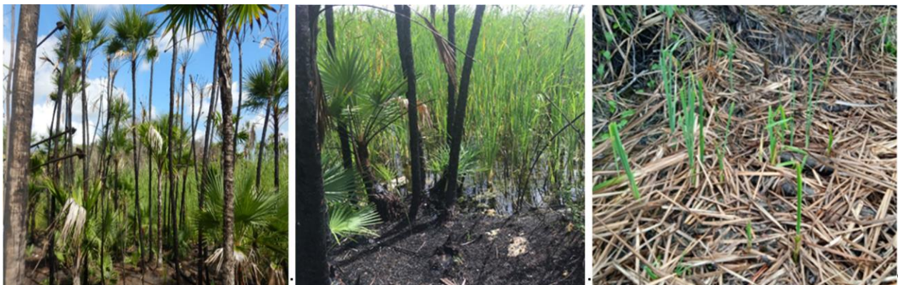
Figura 3. Regeneración del tular y de tasiste, después de la época de lluvias posterior a un incendio, en un ecosistema de sabana inundable de la península de Yucatán

En las áreas de transición entre las sábanas inundables y la selva baja, la presencia del fuego, puede provocar que las especies de selva se vean reducidas, mientras que las especies de sabana se ven favorecidas (Cochrane, 2003). Con lo cual se ocasiona un desplazamiento de la vegetación de selva (Cochrane, 2002), donde se pueden presentar especies de la familia Cyperaceae y algunos helechos, que predominan en sitios perturbados. Además, se pueden encontrar especies que están actuando como invasoras, acaparando los recursos y dificultando el establecimiento de otras especies, sobre todo de especies arbóreas. Entre las especies invasoras se encuentran: Tular