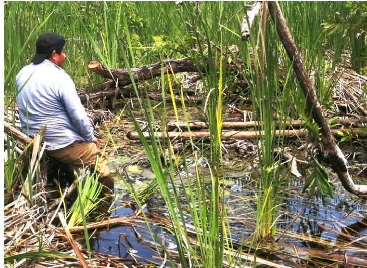
Figura 4. Regeneración de vegetación, en un ecosistema de sabana inundable, afectado por el exceso de agua

( Typha domingensis ), fideo de monte ( Cassytha filiformis ) y helecho ( Pteridium aquilinum ).