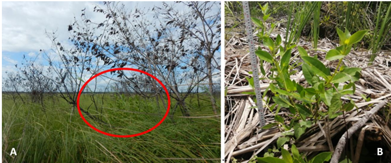
Figura 7. Ecosistema de manglar en la península de Yucatán: A) Individuo afectado por un incendio forestal; y B) presencia de regeneración después de la primera temporada de lluvia

El control de los incendios forestales en manglar es complicado, debido a que se dificulta el acceso a las áreas de manglar, lo cual se debe a que: 1) el arbolado de manglar mantiene sus raíces expuestas, con lo que se forma una red que dificulta el tránsito; 2) las condiciones de inundación del terreno que condiciona, en muchas zonas, que el acceso se tenga que hacer por lancha o helicóptero; y 3) si las condiciones climáticas y de combustibles son adecuadas, el fuego se puede propagar en grandes áreas de manera rápida. De acuerdo con lo anterior, en el caso de vegetación de manglar, en la mayoría de los casos, los efectos de los incendios siempre son severos, ya que son ecosistemas muy sensibles al impacto del fuego. Esto implica que, en muchas ocasiones, estos ecosistemas no se recuperen en su totalidad, pudiendo dar paso a vegetación de pastizal y palmares.