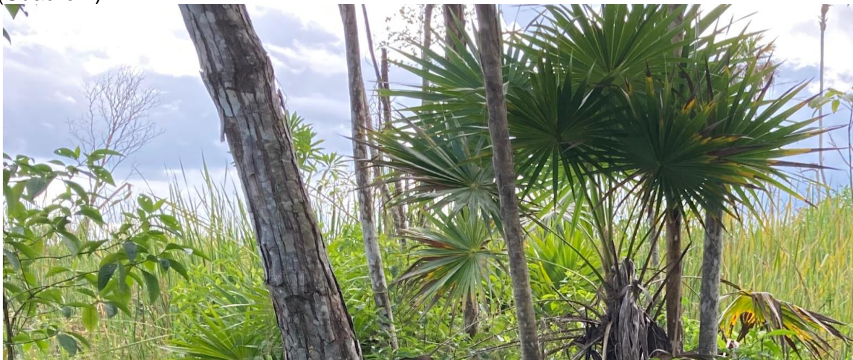
Figura 1. Ecosistema de sabana inundable, en la península de Yucatán, donde predomina palmares (tasistal), pastizal inundable y manglar

Caracterización de la vegetación. Este modelo ecológico parte del escenario inicial de una sabana inundable, constituida por palmares, dominados por tasistales ( Acoelorrhaphes wrightii (Griseb. & H. Wendl.) H. Wendl. Ex Becc.) y pastizales (Figura 1). Estas áreas se encuentran en zonas inundables de transición entre las marismas y pastizales inundables, que se caracterizan por una baja salinidad, donde se asocian varias especies (Cuadro 1).