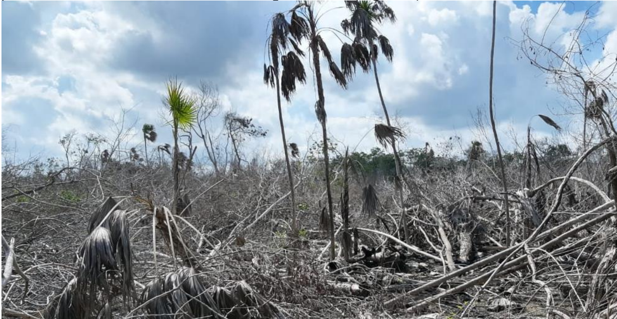
Figura 2. Condición de una sabana inundable después de un incendio, durante la época de sequía, en la península de Yucatán

profundidad del agua llegue a bajas, los suelos son demasiado húmedos, lo cual también puede afectar la sobrevivencia de la regeneración (Figura 4).