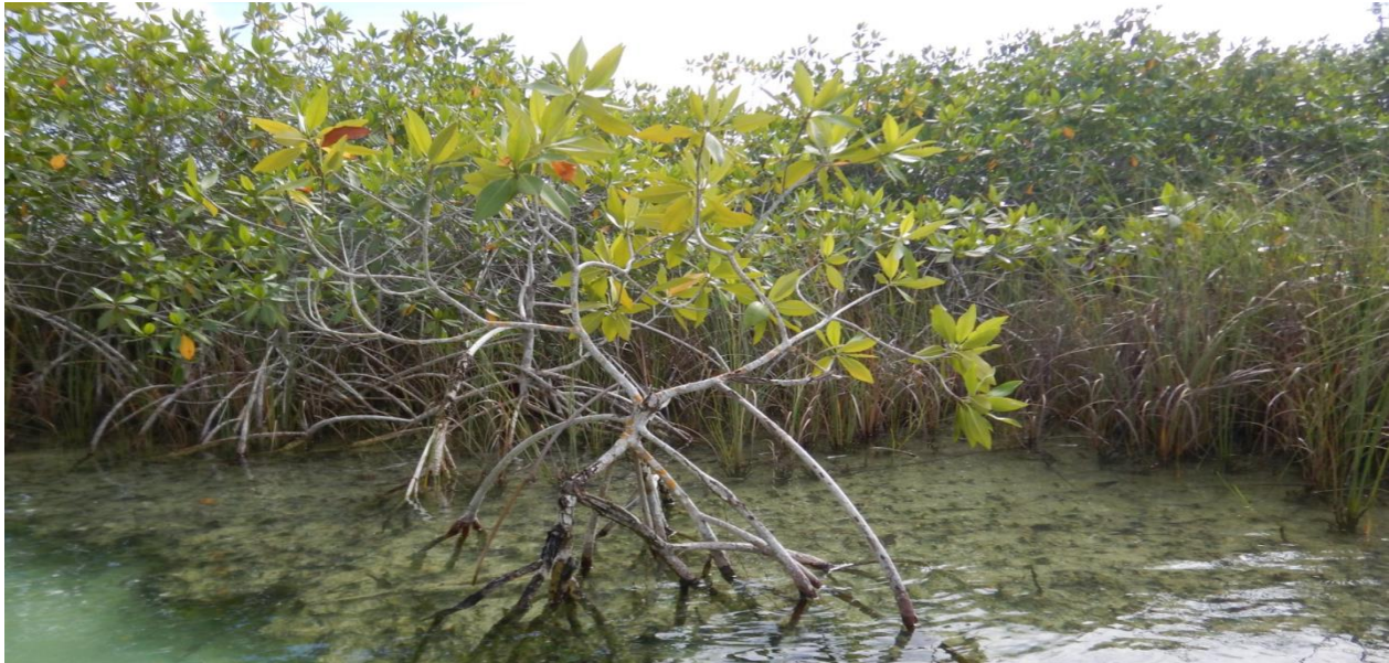
Figura 6. Individuos de manglar asociado con vegetación de pastizal inundable, en la península de Yucatán

Los ecosistemas de manglar brindan diversos bienes ecológicos (Bouillon, 2011), como lo son (Donato et al. , 2022; Walters et al. , 2008): a) el almacenamiento de carbono; b) la regulación de los ciclos de agua; c) hábitat reproductivo para muchas especies. No obstante, los bosques de manglares están disminuyendo (Giri et al. , 2015), donde los incendios forestales son una de las causas importantes, los cuales en su mayoría son causados por actividades humanas (Barrios-Calderón, 2020). Dentro de estas causas, predomina la quema de pastizales en sabanas inundables, donde el riesgo se agudiza por el exceso de material combustible que se genera por el paso de algún huracán. De esta forma, esta alta disponibilidad de combustible puede provocar que el fuego se propague rápidamente, llegando a cubrir grandes superficies en poco tiempo (Darmawan et al. , 2020). En estos incendios no solo se afecta el material combustible muerto, sino también a la vegetación viva, lo cual, a su vez, provoca daños colaterales, como el impacto directo a la fauna, o indirectamente al ocasionar la pérdida, o modificación del hábitat. Esto último es relevante ya que los ecosistemas de manglar sirven como áreas de reproducción de muchas especies de fauna.