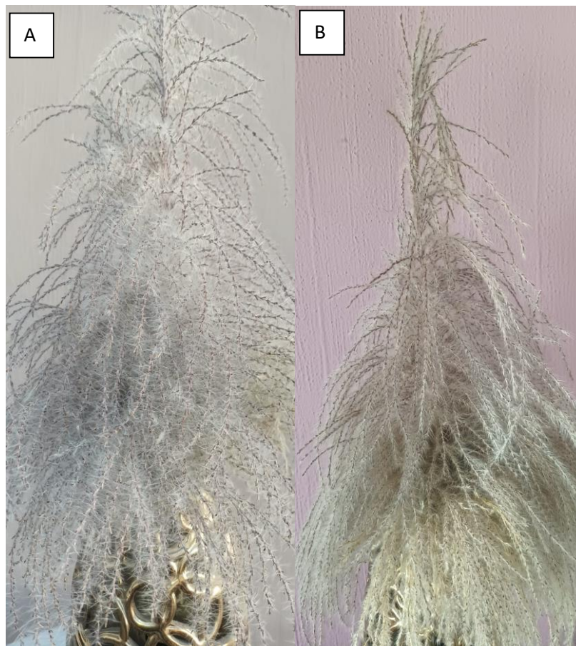
Figura 3. Espiga de la Caña de azúcar. En el primer mes (A) y a los 8 meses (B) de cortada.

Con el tiempo, la calidad de las espigas disminuyó, aunque se mantuvo en un buen nivel con una puntuación mínima de 8 durante los primeros 6 meses, ver Figura 3. Se observó una pérdida progresiva y lenta de las flores, pero después de 10 meses las espigas aún se consideraron útiles como parte de un arreglo floral.