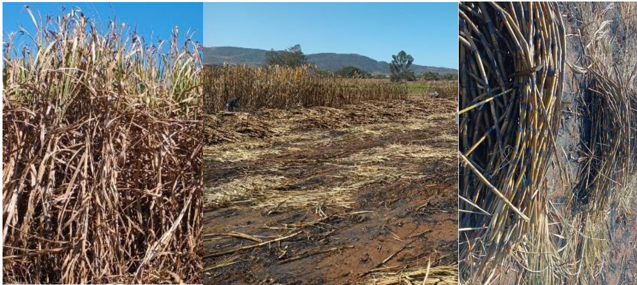
Figura 1. Caña de azúcar ante de quemar, después de quemar y cortada

figura 2, (Moreno, 2022). Como ya se comentó la flor está presente cuando la caña está madura y se tiene que cortar antes de la quema y después realizar la selección. En México, se cultivan más de 800,000 hectáreas de caña de azúcar y cuenta con 49 ingenios azucareros y en el estado de Nayarit se cultivan 34,000 hectáreas, por lo que existen dos molinos de caña donde se procesa o industrializa para la obtención de azúcar comercial y sus productos.