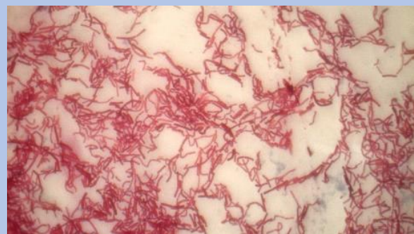
Tinción Gram de aislado de Pseudomonas sp. aislado en zonas contaminadas por residuos plásticos.

durante 90 días, además de plásticos biodegradables, como la licaprolactona (PCL) con 53 % durante 30 días in vitro. En la costa eslovena del mar Adriático del Norte se han descubierto microorganismos ( Aquabacterium ) con capacidad de degradar compuestos aromáticos, así como hidrocarburos vinculados a poliolefinas (polietileno, polipropileno). Por otro lado, en la India se aisló e identificó la bacteria Rastrelliger kanagurta , la cual tiene capacidad de degradar partículas de nylon.